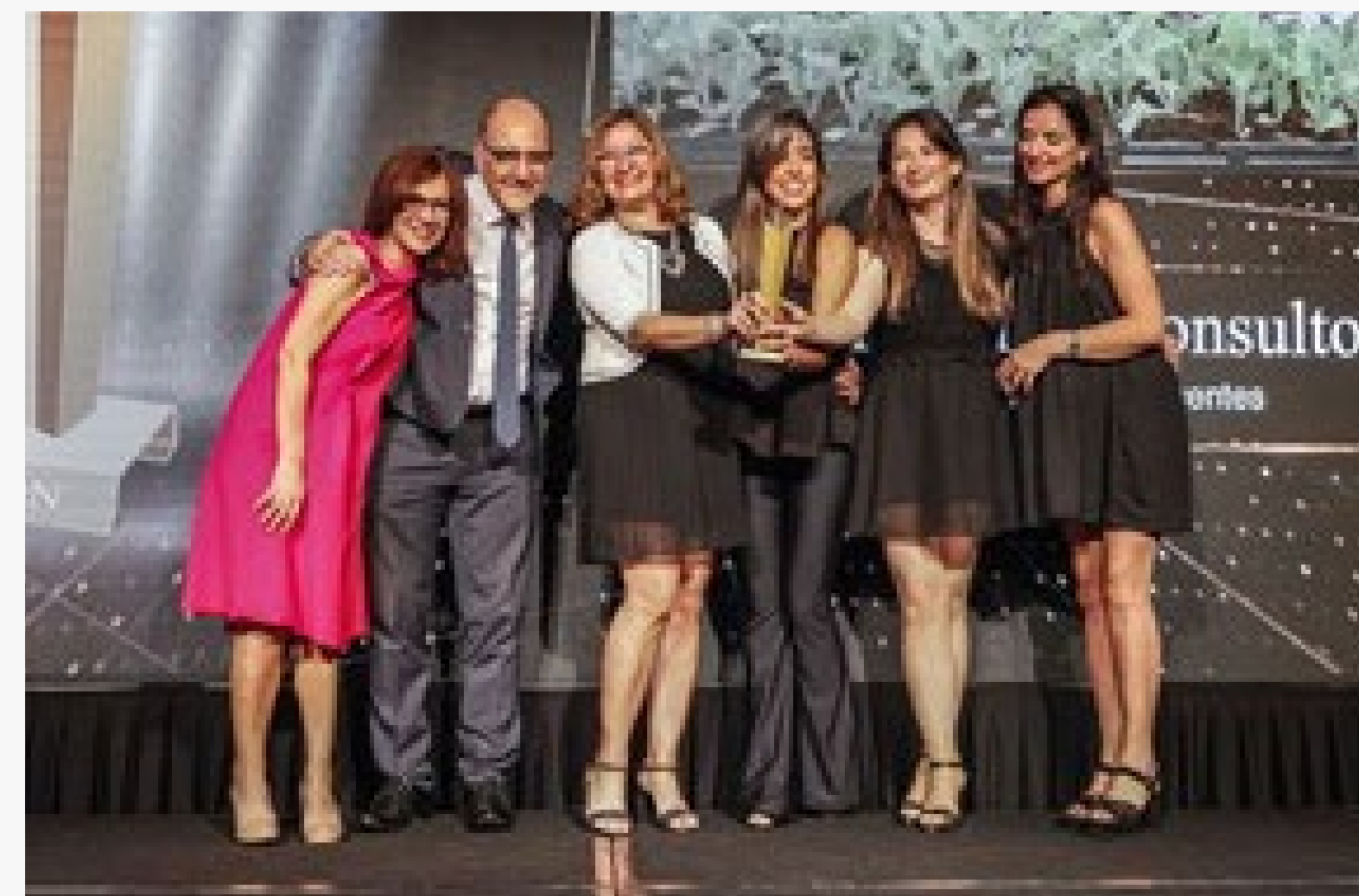
Premio EIKON 2019, Buenos Aires