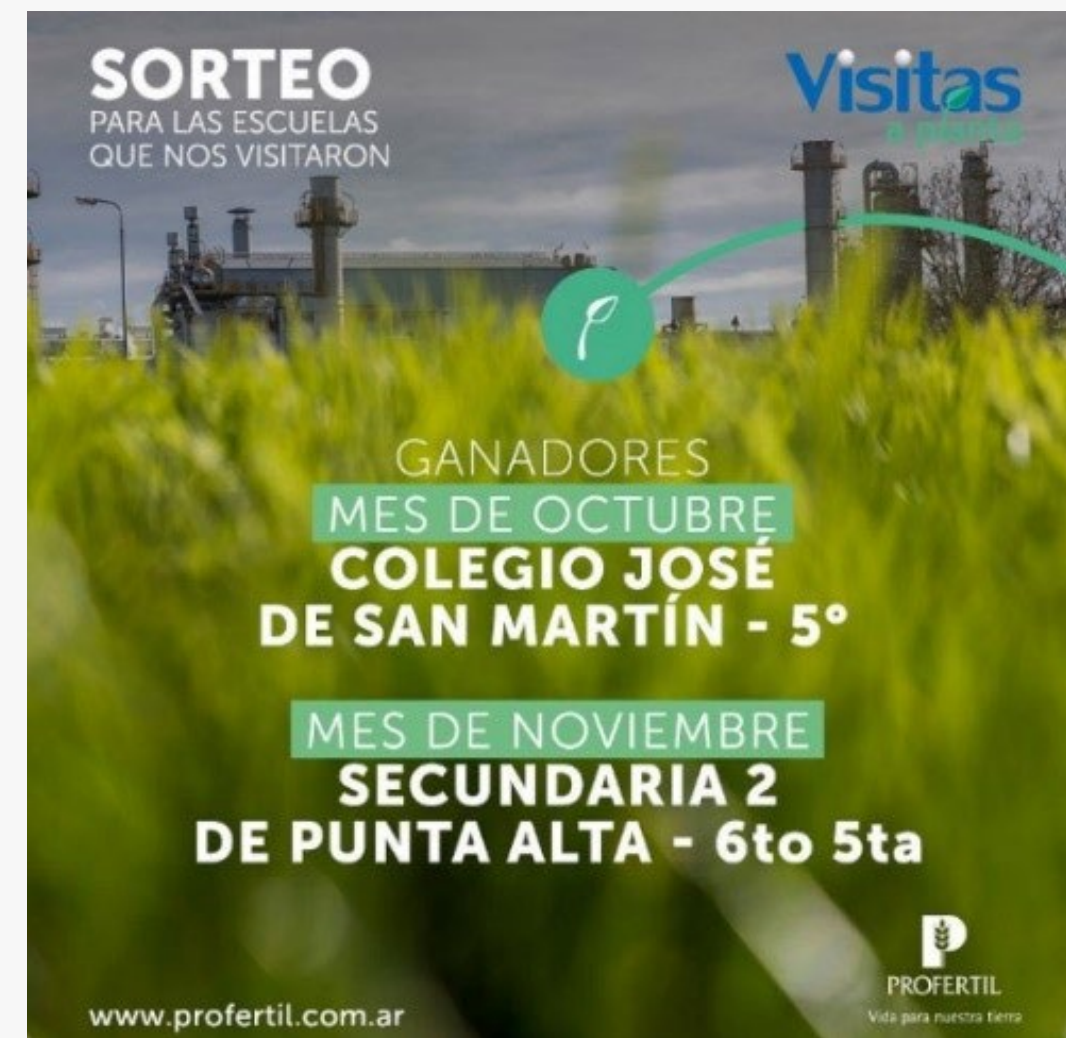
Sorteo para las escuelas que visitaron nuestra Planta Industrial (septiembre - noviembre de 2019)